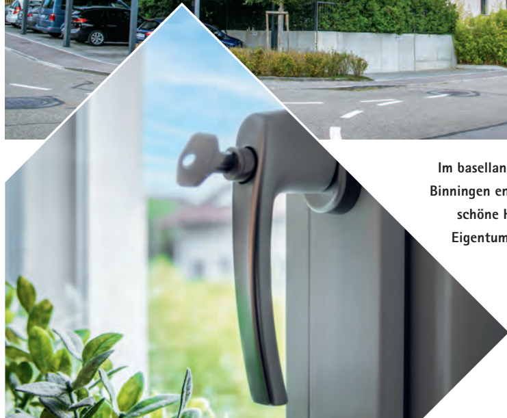
Im basellandschaftlichen Binningen entstand dieses schöne Haus mit fünf Eigentumswohnungen.

«HEUTE FÜHLT SICH DAS BETROFFENE EHEPAAR SICHER UND WOHL IN SEINER WOHNUNG.»